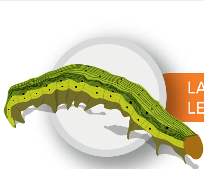
LARVAS DE LEPIDÓPTEROS

Exalt® 6 SC es altamente eficiente en el control de lepidópteros, prodiplosis, trips y minadores y tiene un bajo impacto sobre la fauna benéfica.